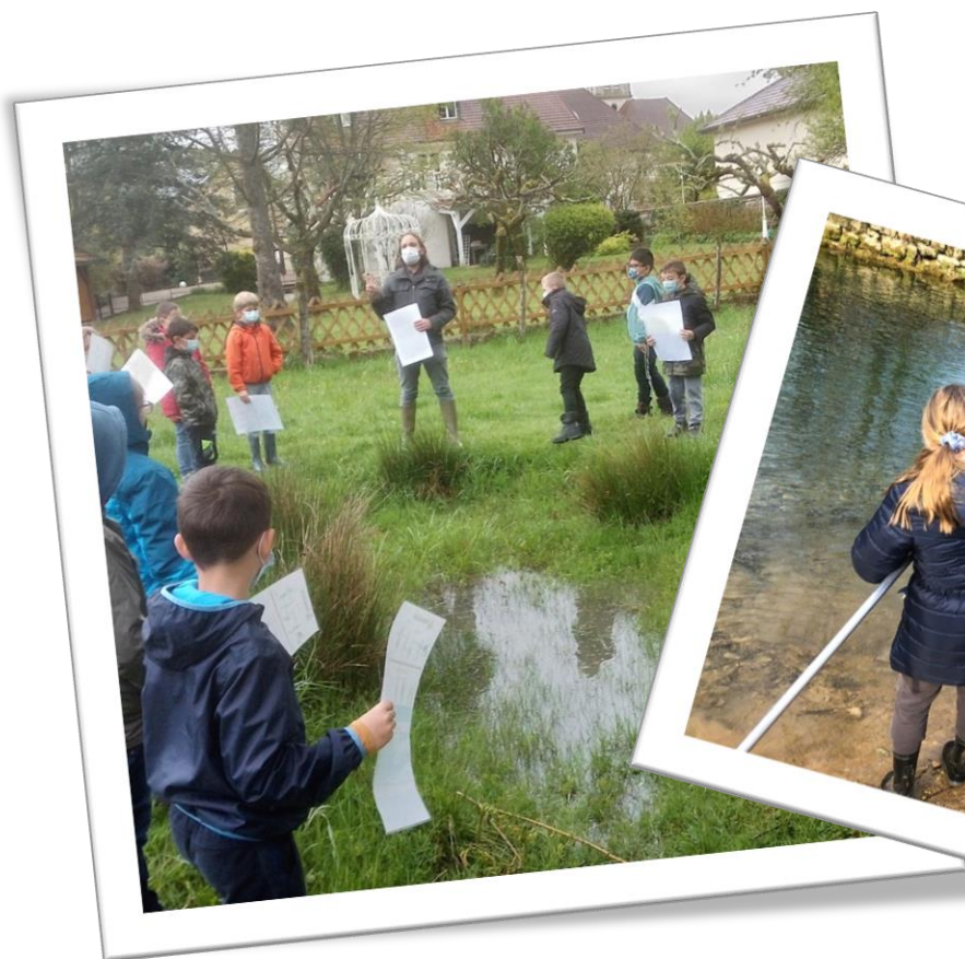
CPIE du Haut-Doubs

Programme scolaire sur le territoire du Contrat Haut - Doubs Loue